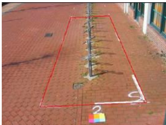
Înainte de a se folosi ECO-Gard®